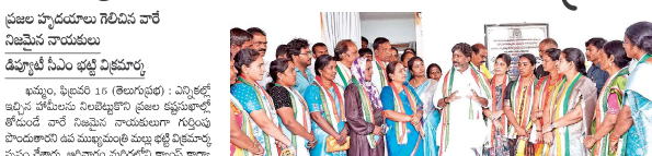
ప్రజల అభివృద్ధికి గౌరవం వారే నిజమైన నాయకులు